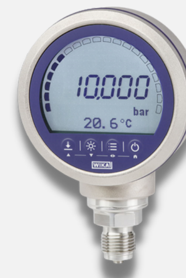
Maômetro digital padrão com termômetro integrado